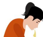
pagsusuka at duruwal