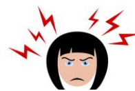
masakit na ulo